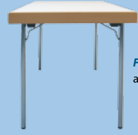
Ferrure en H ajustable