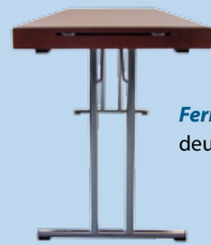
Ferrure en T deux colonnes