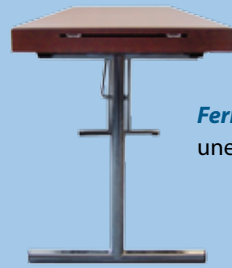
Ferrure en T une colonne