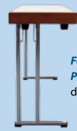
Ferrure Parliamentarisch deux colonnes