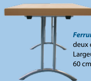
Ferrure Kufen deux colonnes Largeur minimum 60 cm