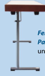
Ferrure Parliamentarisch une colonne