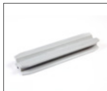
X-Connecteur en macrolon pour insérer