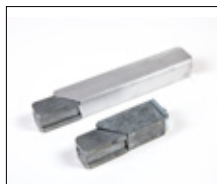
Jonction rapide en métal pour visser